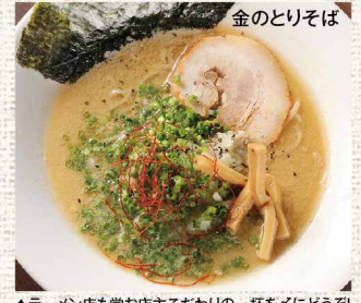
▲ラーメン店も営む店主こだわりの一杯をどうぞ!

鮪屋さんきゅう丸さんは、顧問を通して買い付けた鮪を、他では出せない低価格にてご提供しています。中でもランチのパチまぐろ丼:980円(税抜)は店主一押し一品です。他にもランチメニューが豊富ですので、リピートしたくなるの間違いなし! 夜はまぐろしゃぶしゃぶを中心にまぐろ好きにはたまらないメニューの数々です。とことん“まぐろ”を極めた専門店に足を運んで見て下さい。