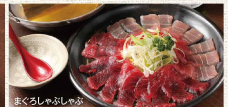
まぐろしゃぶしゃぶ