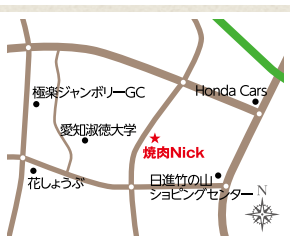
アクセス:リニモ秋ヶ池公園駅2出口より徒歩約33分

ワインやウイスキーの種類も充実しておりますので、上品でおいしいお肉を食べながらお酒を嗜むのも楽しみ方の一つだと思います。是非一度お試しあれ!